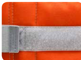
Orange Rozmiar 0a, 1