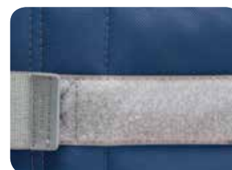
Blue Horizon Rozmiar 3a, 4