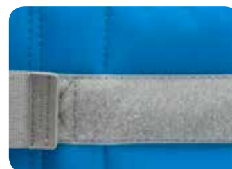
Blue Rozmiar 1a, 2