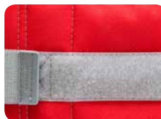
Red Rozmiar 2a, 3